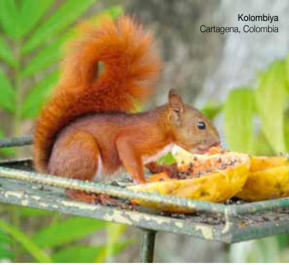
Kolombiya Cartagena, Colombia