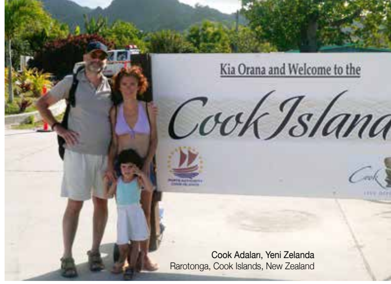
Cook Adaları, Yeni Zelanda Rarotonga, Cook Islands, New Zealand