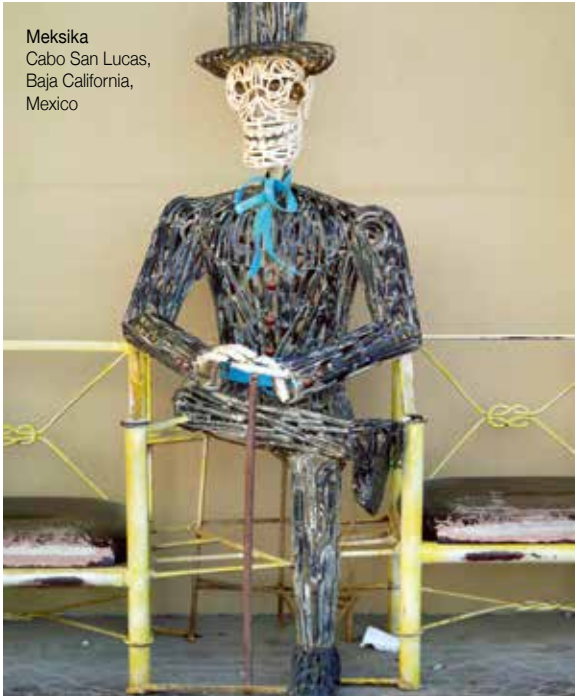
Meksika Cabo San Lucas, Baja California, Mexico