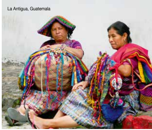
La Antigua, Guatemala