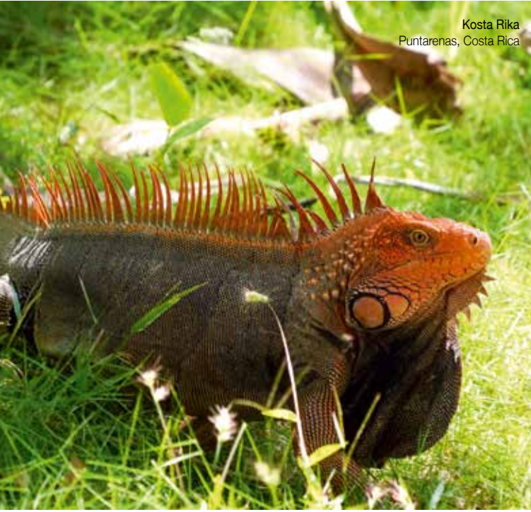
Kosta Rika Puntarenas, Costa Rica