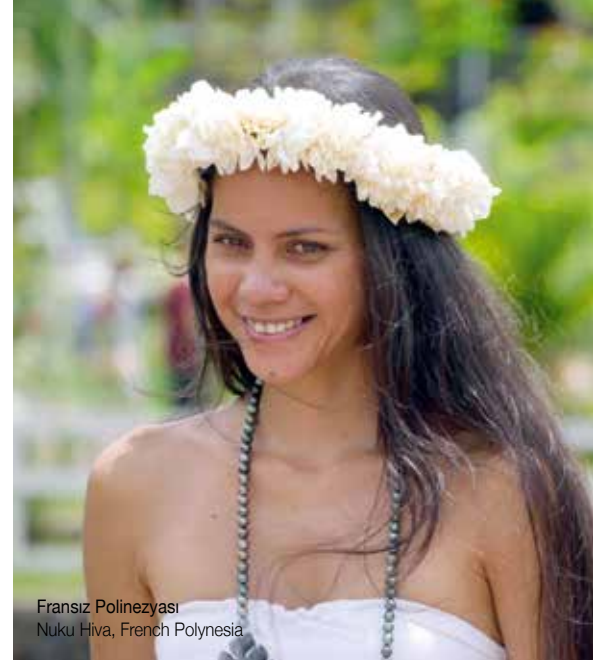
Fransız Polinezyası Nuku Hiva, French Polynesia