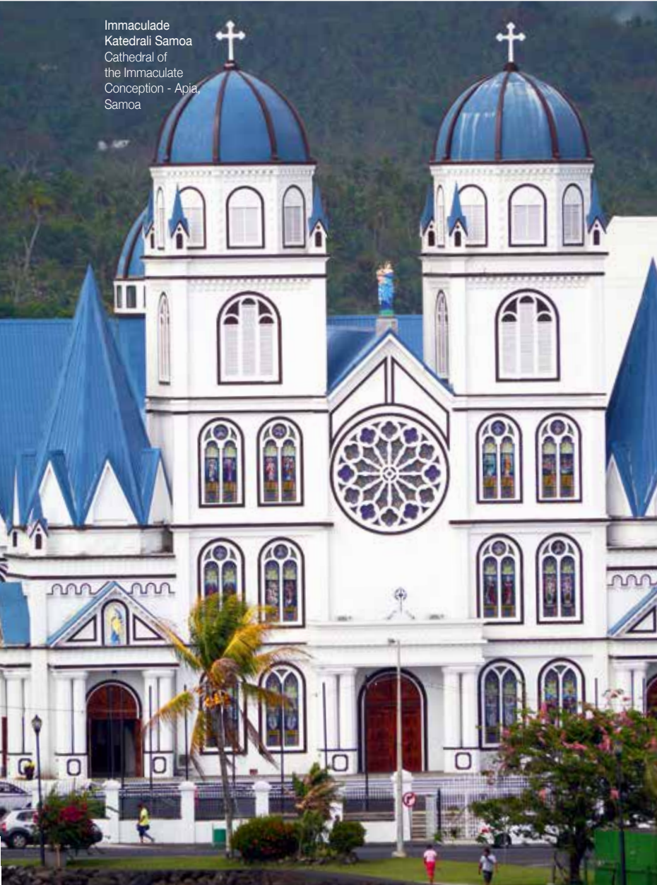
Immaculate Katedrali Samoa Cathedral of the Immaculate Conception - Apia, Samoa